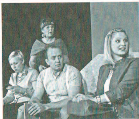
Auch Backstage ist einiges los.

Das Wilchinger Theater spielt noch in dieser Woche am Dienstag und Mittwoch, 10. und 11. März, und am Freitag (Dernière), 13. März, jeweils um 20 Uhr im Storchensaal. Der Vorverkauf läuft täglich von 18 bis 20 Uhr unter 079 756 26 13 oder online unter www.wilchinger-theater.ch . (sgh)